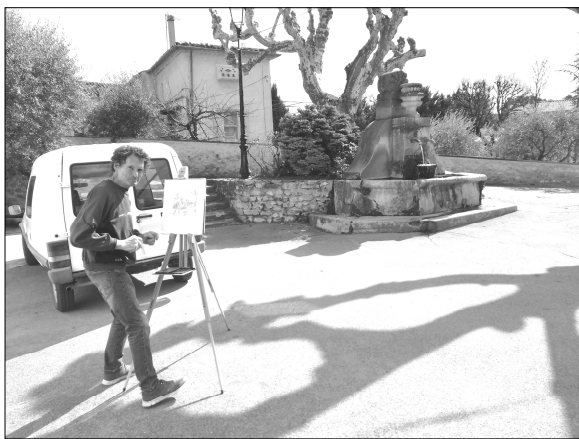
L'artiste en plein travail, dessin de la couverture de la « gazette » 2019.

La prochaine édition de la Gazette sera prévue début juillet 2019